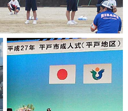
WIIII 1月 平戸地区の成人式