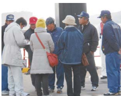
2013年11月.30日 原子力防災訓練