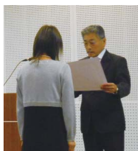
15年以上と10年以上の方それぞれお一人ずつ表彰されました。おめでとうございます。

2013年12月8日 勤労者の祭典 優良従業員表彰があり、7名の方が表彰されました。20年以上の方が5名、