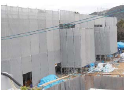
2月11日 星鹿小学校改築工事 あと一か月で、教室が使えるようになるでしょう。6年生が待っています。