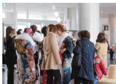
1月4日 松浦市成人式 327人の新成人のみなさん。おめでとうございます。