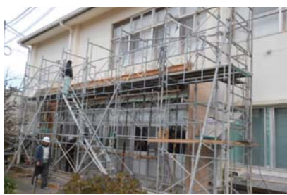
2013年12月.26日 鷹島町水仙苑の工事 鷹島町にある松浦市高齢者生活福祉センター水仙苑の原子力災害対策施設整備事業(国の予算です)。

2013年12月8日 勤労者の祭典 優良従業員表彰があり、7名の方が表彰されました。20年以上の方が5名、