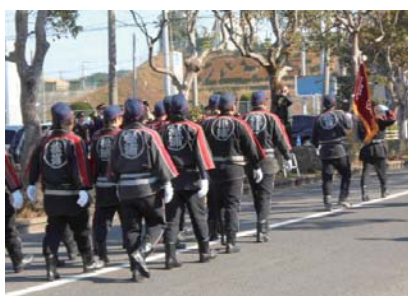
1月7日 出初式 消防出初式。団員899名の方が、地域を守っています。新しく団員になられた方々35名。ご苦労様です。