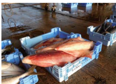
1月6日 魚市仕事始め 大漁満足・航海安全・商売繁盛を願うの行事始め式でした。