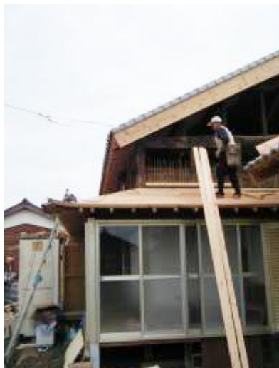
補助を受けて行われたリフォーム工事

※リフォーム補助：平戸の人が平戸の業者でリフォームを行うとき、工事費が三十万円以上の工事であれば、費用の一〇%、最高十万円まで補助を受けられるという制度